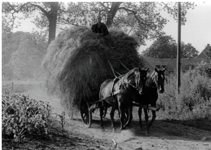
Heuernte in der Elchniederung

So waren die Mennoniten schließlich (land)wirtschaftlich außerordentlich erfolgreich, wozu auch die für Weidewirtschaft vorzüglich geeignete Bodenqualität beitrug – ähnlich gute Lebensbedingungen, wie sie sie aus Holland und den Weichselniederungen kannten. Besonders in der Käsefabrikation waren die Mennoniten erfolgreich. Innerhalb von 5 Jahren konnten sie die Produktion des sogenannten „Mennonitenkäse“ (später Tilsiter Käse) um 245 % auf 3700 Ztr. im Jahre 1723 steigern. 1724 aber – im Jahr der Vertreibung – wurden nicht einmal mehr 20 % der Vorjahresmenge nach Königsberg geliefert. 43